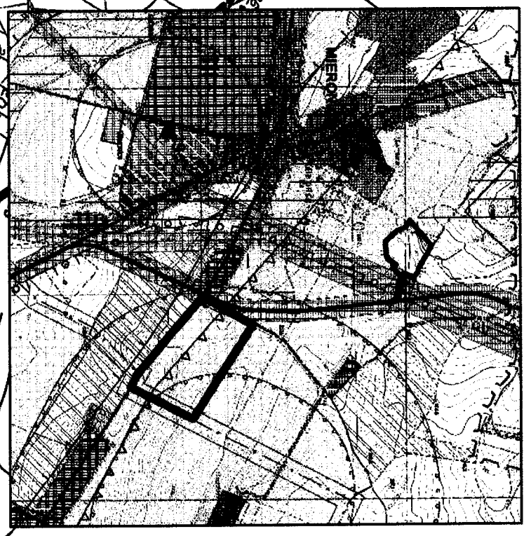
ORIENTACJA W SKALI 1 : 25 000